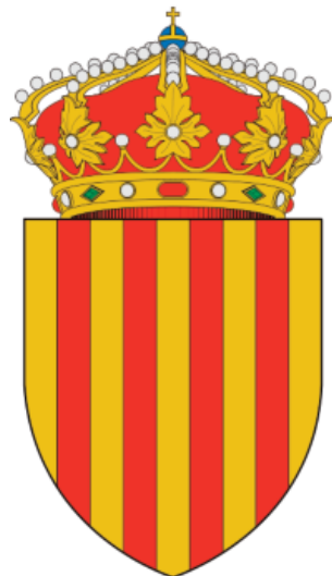
Escudo de Cataluña con los palos aragoneses

Así la Corona de Castilla y su Imperio de las Indias aportarían 44.000 soldados; el Principado de Cataluña, el Reino de Portugal y el Reino de Nápoles, 16.000 cada uno; los Países Bajos del sur, 12.000; el Reino de Aragón, 10.000; el Ducado de Milán, 8.000; y el Reino de Valencia y el Reino de Sicilia, 6.000 cada uno, hasta totalizar un ejército de 140.000 hombres. El Conde-Duque pretendía hacer frente así a las obligaciones militares que la Monarquía de la Casa de Austria tenía contraídas para mantener su supremacía cada vez más acosada.