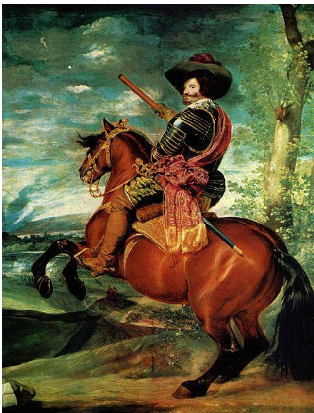
El Conde Duque de Olivares

El clima de desconfianza y enfrentamiento entre población y los soldados enturbió aún más las ya muy difíciles relaciones entre las instituciones del Principado y la Corona a causa de los intentos de ésta por uniformar la administración, los impuestos y las levas, llegándose al extremo del ofrecimiento por la Diputación de Cataluña al rey francés Luis XIII del título de Conde de Barcelona.