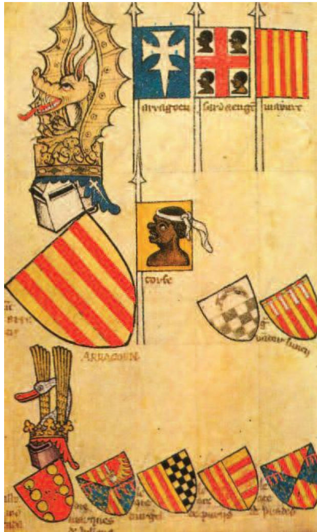
Señal del Rey de Aragón

El Conde-Duque de Olivares, necesitado de dinero y de hombres, confiesa estar harto de los catalanes: « Si las Constituciones embarazan, que lleve el diablo las Constituciones ». En febrero de 1640, cuando ya hace un año que la guerra ha llegado a Cataluña, Olivares le escribe al virrey Santa Coloma en los siguientes términos: